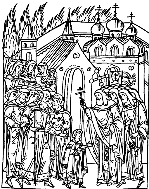
Больной Василий III прибывает в Волоколамский монастырь Миниатюра Лицевого летописного свода. XVI в.

умом». Впрочем, Василию III так и не удалось узнать об этом. На радостях, имея уже двух сыновей, великий князь разрешил жениться своему младшему брату Андрею Ивановичу Старицкому. Торжество состоялось 2 февраля 1533 года в Москве, супругой удельного князя стала княжна Ефросиния Андреевна Хованская. В этом браке родился князь Владимир Андреевич, двоюродный брат Грозного, человек трагической судьбы.