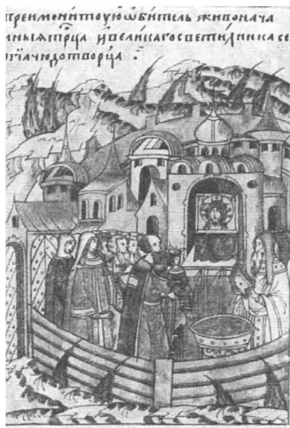
Крещение Ивана IV Миниатюра Лицевого летописного свода. XVI в.

В угоду ей, по рассказам того времени, он решился на такой неординарный шаг, как бритье бороды, что осуждалось Церковью.