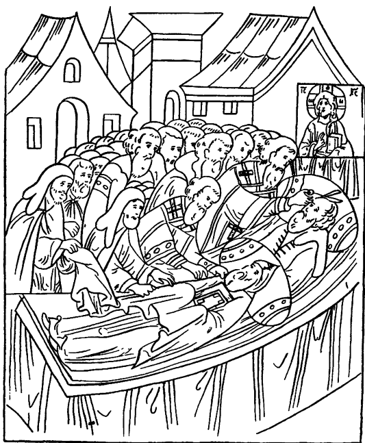
Пострижение умирающего Василия III Миниатюра Лицевого летописного свода. XVI в.

Уладив мирские дела, великий князь, несмотря на возражения князя Андрея и некоторых бояр, принял постриг. Летопись описывает спор между митрополитом Даниилом и Андреем Старицким, развернувшийся у постели умирающего. Дело дошло до того, что Даниил стал угрожать Андрею отказом в благословении. Трудно было сказать, постригли ли Василия еще при жизни или уже после смерти. Лишь любимец великого князя Шигона, находившийся у постели, видел, как «дух его отшедша, аки дымец мал», это и подтвердило, что Василий был пострижен еще живым. При пострижении умирающий получил имя Варлаам. Это произошло в ночь с 3 на 4 декабря 1533 года*.