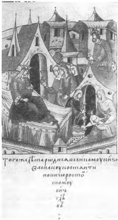
Рождение ребенка в княжеской семье Миниатюра Лицевого летописного свода. XVI в.

монастыре. Присутствовал малыш и на освящении знаменитой церкви Вознесения в Коломенском*. Конечно, наследник престола сразу же после рождения играл заметную политическую роль: в соглашении с Юрием Дмитровским Василий III специально оговорил обязательство князя Юрия быть верным не только самому великому князю, но и его сыну Ивану. Ивану же было к тому времени всего около года. Такое же обязательство было взято с князя Федора Михайловича Мстиславского и, вероятно, с других представителей знати.