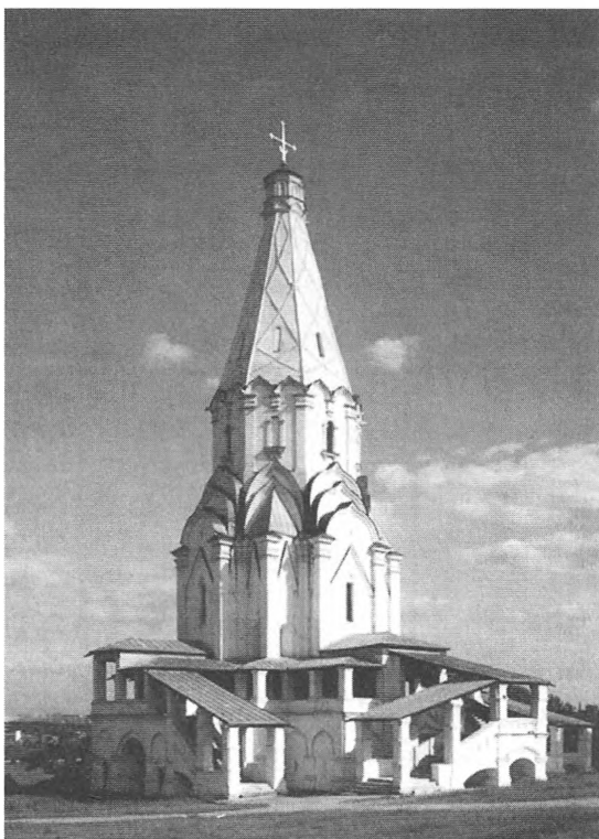
Церковь Вознесения в Коломенском. Построена в 1530–1532 гг. Фотография конца XX в.

со знаменитым в будущем Иосифом, основавшим спустя некоторое время Волоцкую обитель. После основания нового монастыря Кассиан пришел к Иосифу и оставшуюся часть жизни провел в новом монастыре, изнуряя тело веригами, поклонами и постами*.