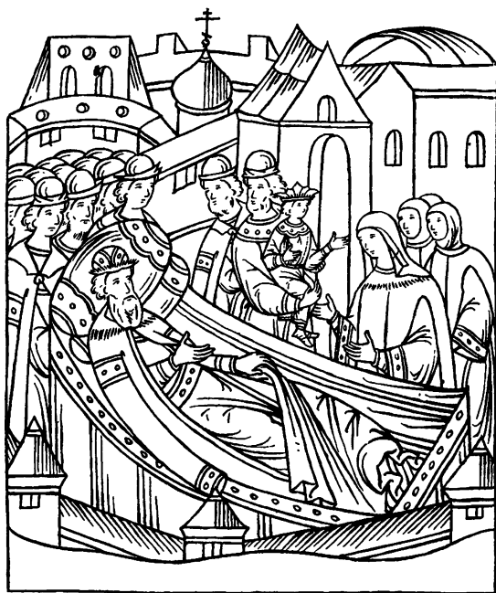
Василий III прощается с сыном Иваном Миниатюра Лицевого летописного свода. XVI в.

великий князь буквально за несколько часов до смерти летопись называет Михаила Захарьина, Михаила Львовича Глинского, Шигону. Потом к умирающему был позван Андрей Старицкий.