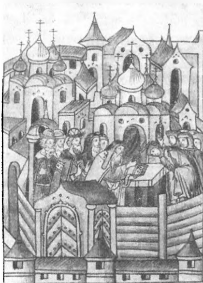
Пострижение великой княгини Соломонии Сабуровой Миниатюра Лицевого летописного свода. XVI в.

версия выглядит иначе: Соломония была пострижена насильно. Эти известия дошли и до находившегося в России с дипломатической миссией Сигизмунда Герберштейна. Он красочно описал сцену пострижения: «В монастыре, несмотря на ее слезы и рыдания, митрополит сперва обрезае ей волосы, а затем подал монашеский куколь, но она не только не дала возложить его на себя, а схватила его, бросила на землю и растоптала ногами. Возмущенный этим недостойным поступком Иоанн Шигона, один из первых советников, не только выразил ей резкое порицание, но и ударил ее плеткой, прибавив: “Неужели ты дерзаешь противиться воле государя? Неужели медлишь исполнить его веление?” Тогда Саломея спросила его, по чьему приказу он бьет ее. Тот ответил: “По приказу государя”. После этого она, упав духом, громко заявила перед всеми, что надевает куколь против воли и по принуждению и призывает Бога в мстители столь великой обиды, нанесенной ей»*. О том, что пострижение было насильным, сохранились и другие известия. Так, согласно Постниковскому летописцу, на великую княгиню перед пострижением, 28 ноября была наложена