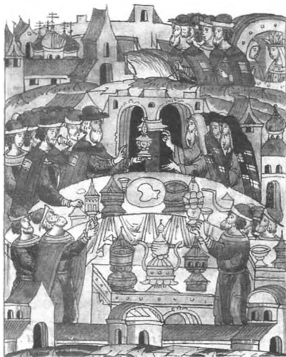
Пир Василия III с митрополитом и боярами в Коломенском Миниатюра Лицевого летописного свода. XVI в.

Но было одно обстоятельство, которое не могло не тревожить великого князя, — это вопрос о наследнике. Двадцатилетний брак с Соломонией не принес потомства, между тем Василий был уже далеко не молод, особенно по меркам того времени — к середине двадцатых годов XVI века ему было далеко за сорок. Были испробованы все доступные в то время средства — паломничества по монастырям, обильная милостыня, посты, молитвы. Но ничего не помогало. Конечно, у Василия были наследники — его родные младшие братья Юрий Дмитровский и Андрей Старицкий, но, по одной из повестей, великий князь считал, что им нельзя оставлять государство, так как они